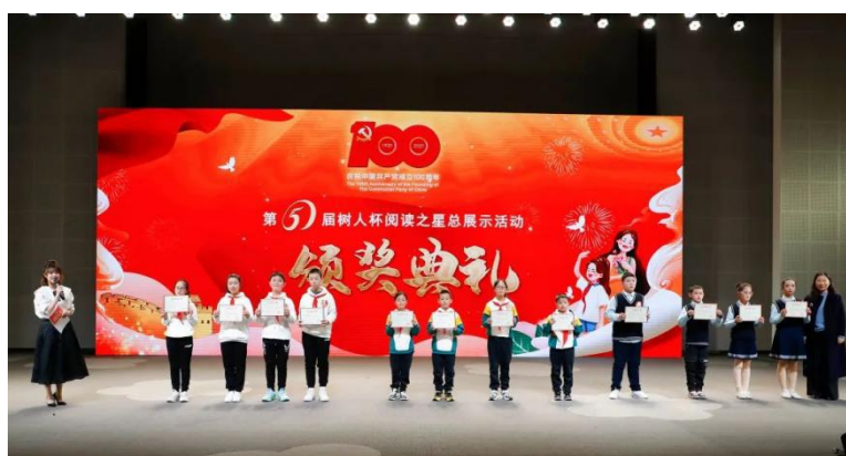
“星·辞海遨游”优胜奖