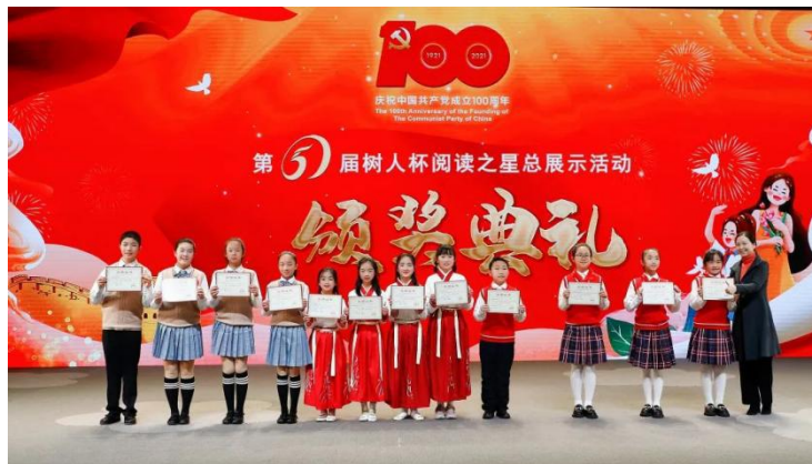
“星·经典演读”优胜奖

台的孩子实现了文化的传承、知识的掌握，一点点读懂和践行着中华民族伟大复兴的中国梦！