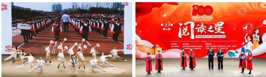
谢家湾学校和市老年大学分别呈上精彩的班级自编操和诗朗诵节目

重庆市老科协协会会长欧可平，重庆市委教育工委委员、市教委副主任李劲渝，重庆市教委一级巡视员邓睿，重庆市教育学会会长钟燕、重庆第二师范学院党委书记张艳，重庆市教育科学研究院院长蔡其勇，重庆市高等教育学会首席专家张宗萌，九龙坡区委教育工委书记、区教委主任王家仕，重庆市教育学会阅读教育专业委员会秘书长、树人教育研究院院长、重庆市政协委员王雁玲，以及市教委相关处室、区教委、市老年大学、市教育学会部分领导和嘉宾出席了开幕式。