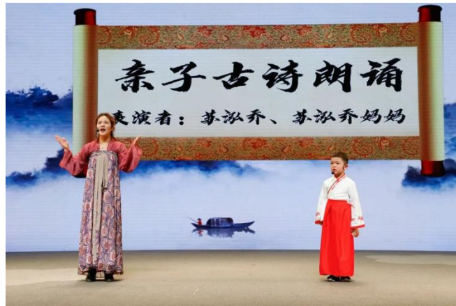
温馨的亲子诵读节目

“星·经典演读”环节以“传承红色基因 致敬百年征程”为主题，以弘扬“革命文化和社会主义先进文化”为内容设定。