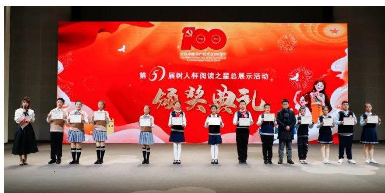
“星·诗词大会”优胜奖